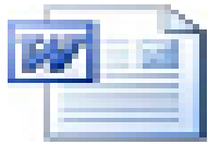
Bijlage Matrix van verplichtingen en bijbehorende sancties

Fases: De aanvullende en nawettelijke uitkering